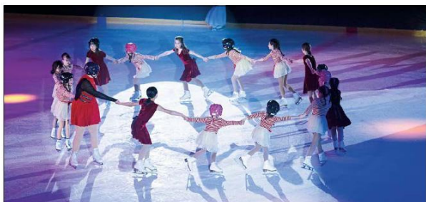
« Charlie et la chocolaterie » était le thème pour les patineuses du groupe PP D.