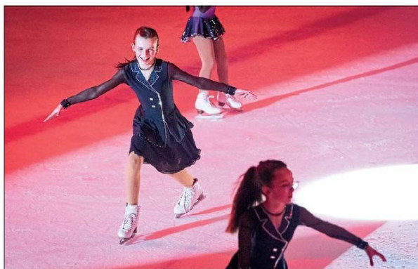
Le groupe de la catégorie STAR 2 s'est inspiré du film « Descendants » pour son numéro.