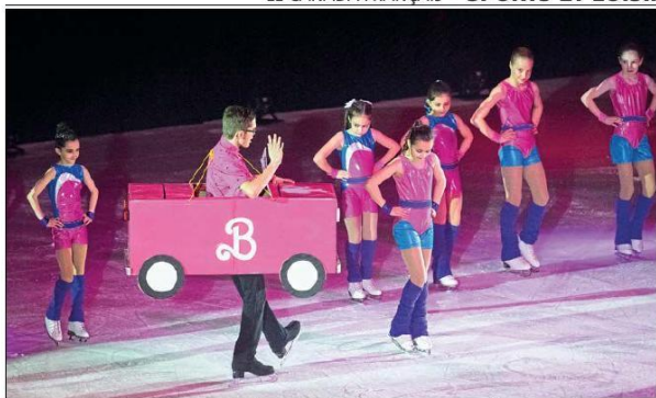
Le Club de patinage artistique a présenté son gala annuel sous le thème « Pure » au Colisée Isabelle-Brasseur les 13 et 14 avril. Le groupe de la catégorie STAR 3 a interprété une chorégraphie qui avait pour thème « Barbie ».