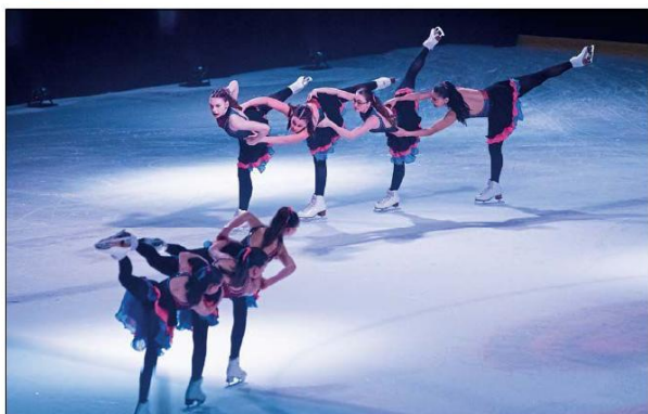
La performance de l'équipe Illusion, de la catégorie Juvénile, avait pour thème « Girl power ».